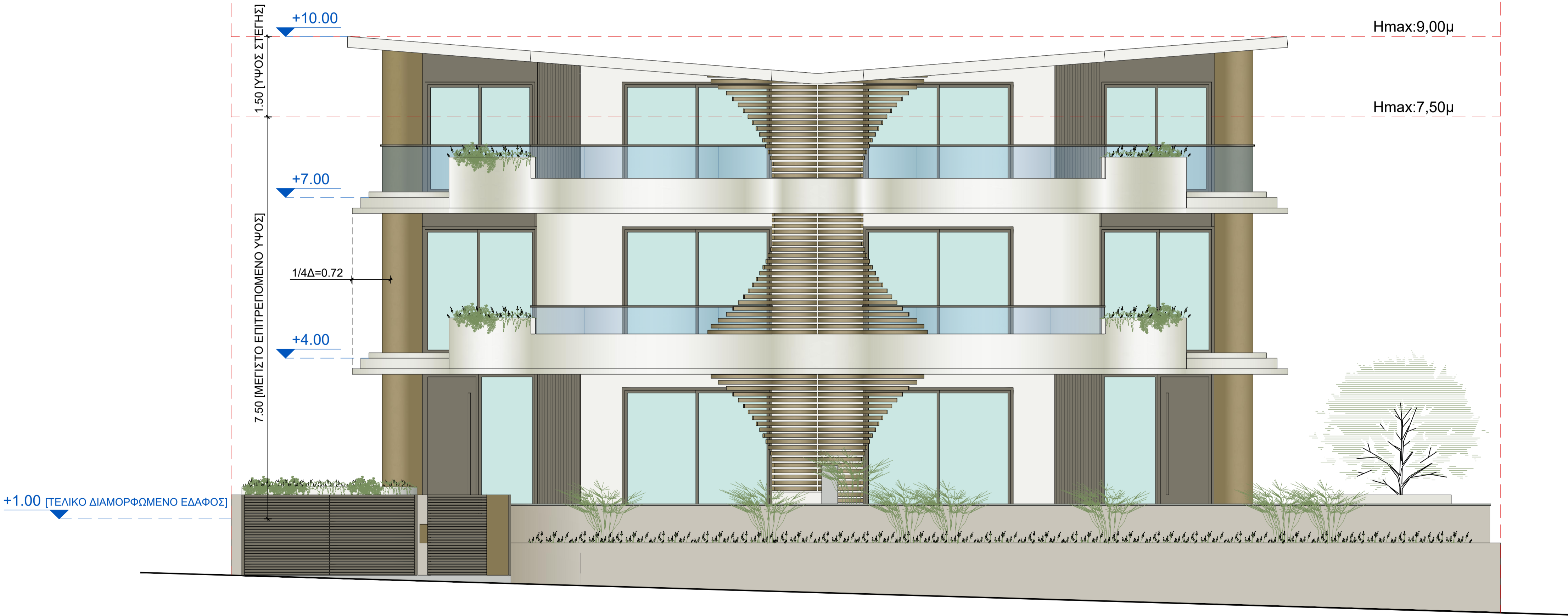
ΟΨΗ Τ01 [ΝΟΤΙΑ]